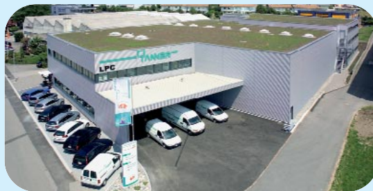
Logistik- und Produktionscenter (LPC) Logistics and production centre

ATS ist auf allen 5 Kontinenten vertreten. ATS is represented on all 5 continents.