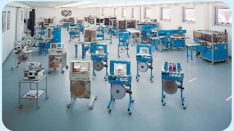
Ausstellungsraum von 300 m 2 300 m 2 showroom

Polígono Leizotz, Parcela I, Nave 7 ES-20140 Andoain (Guipúzcoa) Phone +34 943 303023 Fax +34 943 303021 www.ats-tanner.es , info@ats-tanner.es