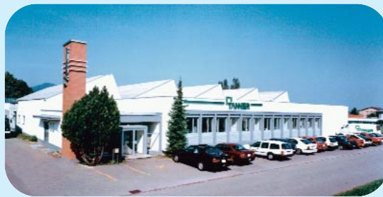
Verkaufs- und Servicecenter (VSC) Sales and service centre